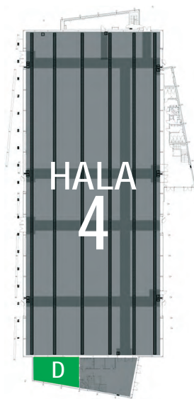
Sala D - rzut sali